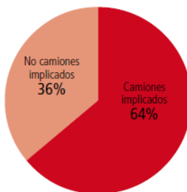
Accidentes mortales con vehículos pesados implicados (período 2012-2015)