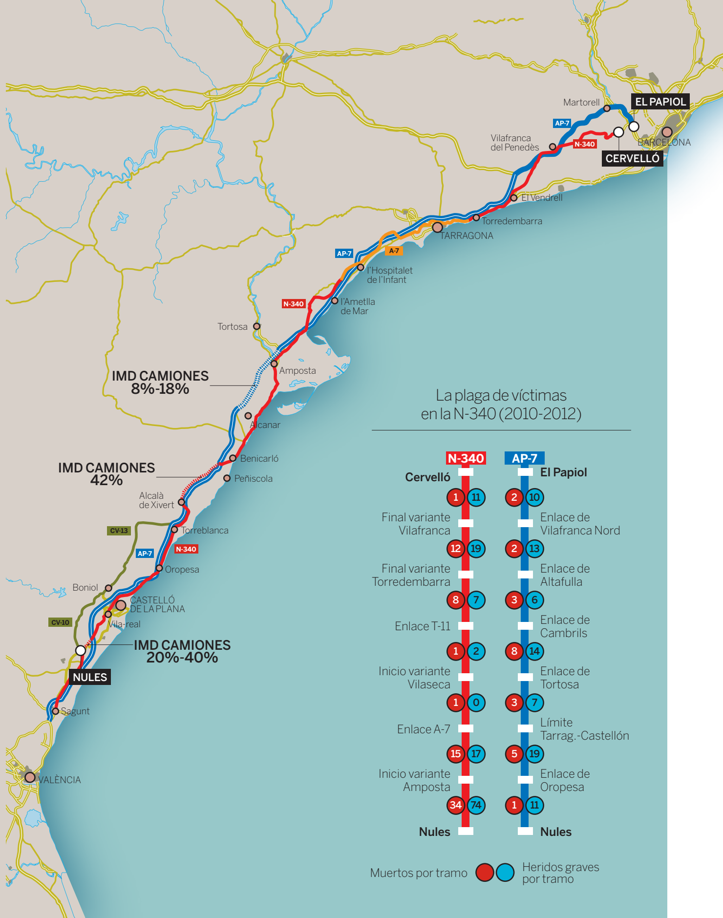
La plaga de víctimas en la N-340 (2010-2012)

* COSTE ESTIMADO PER VÍCTIMA SEGÚN DGT. INCLUYE COSTES DE INTERVENCIÓN DE EQUIPOS DE EMERGENCIA, COSTES SANITARIOS Y HOSPITALARIOS, DE REHABILITACIÓN, DAÑOS MATERIALES Y HORAS DE PRODUCTIVIDAD PERDIDA